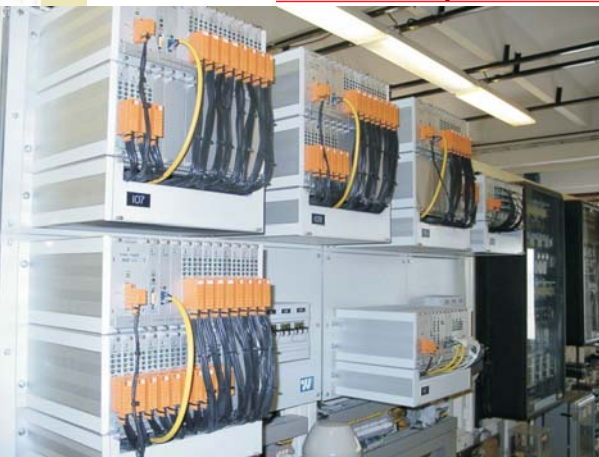
Központi elhelyezésű alállomási irányítástechnika