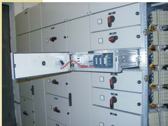
Logstrup-típusú fiókos elosztó rendszer