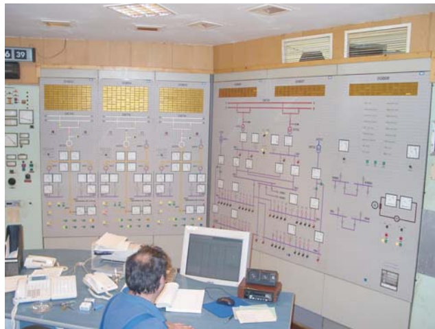
Erőművi vezénylő mozaikos rendszerrel